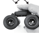
センターフォーカス

近視の方は右方向、遠視の方は左方向に動かします。一度視度調節しておく、次からは焦点合わせだけを行えば鮮明な拡大像を楽しむことができます。